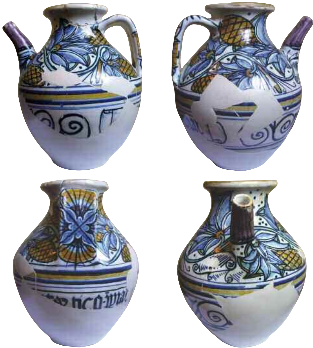
Tavv. 8 a-d – Urbino fine sec. XV. Vaso da farmacia; già collezione privata Urbino, ubicazione sconosciuta.