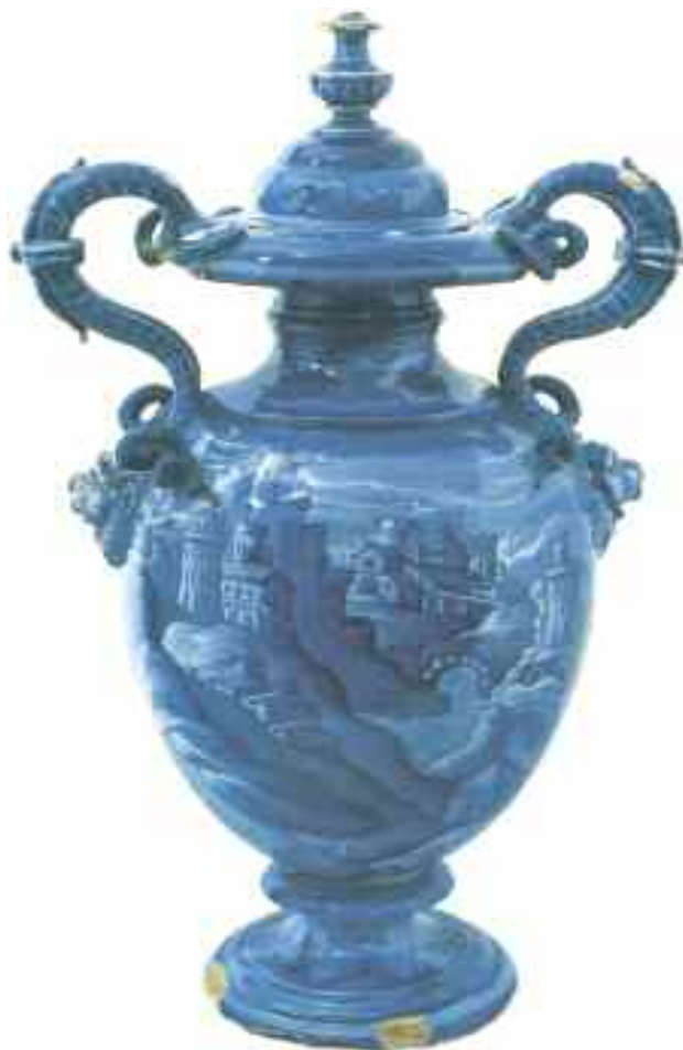
Tav. 14 - Urbino, bottega Alfonso Patanazzi (?) primo quarto XVII sec. Vaso biancato (già collezione Istituto d'Arte); Galleria Nazionale delle Marche, Urbino.

Accanto ai preziosi frammenti di maiolica policroma che vedono un ampio campione di tipologie decorative, dalle stilizzazioni gotico-floreali allo stile compendiario (fig. 17), anche in questa occasione è stato importante poter recuperare alcuni oggetti in terracotta (figg. 18-20), utilizzati specialmente in cucina 51 , testimonianza di una vita monastica cadenzata nei lavori di ogni giorno anche da oggetti ceramici umili ma utilissimi.