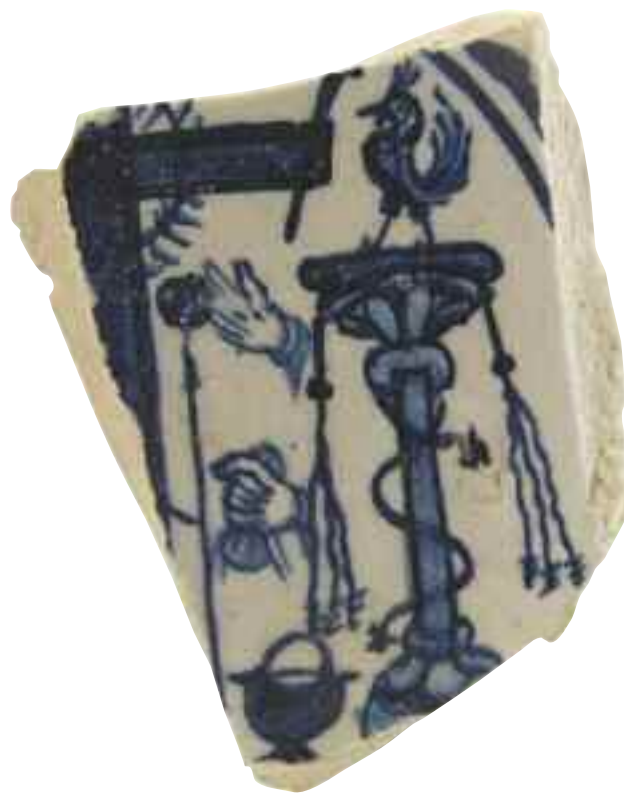
Tav. 6 - Urbino fine sec. XV. Frammento di ciotola; Istituto Superiore per le Industrie Artistiche, Urbino.

Ma a destare maggior interesse in quanto rappresenta un unicum nel panorama ceramico locale è sicuramente il grande boccale con insegna commerciale o farmaceutica, che pur nella sua frammentarietà non trova eguali per qualità materica e composizione decorativa, distribuita quasi nella totalità della superficie con motivi di foglie accartocciate , occhi di piume di pavone ed inflorescenze 14 . (fig. 9). Per poter indagare in modo approfondito l’emblema raffigurato sul boccale necessita vagliare diverse ipotesi. La presenza di una farmacia all’interno del convento è sicuramente plausibile in quanto la vita monastica di clausura implicava necessa-