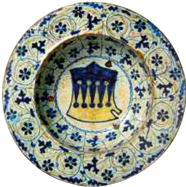
Tav.4 - Manises, fine sec. XV. Piatto a lustro con stemma famiglia Agostini di Fabriano; Museo Arti Applicate Copenhagen.

tivamente correnti e ondulate. La singolare ciotola non trova confronti stilistici con le produzioni fino ad ora note di fine Quattrocento, ma è possibile ipotizzare una produzione locale 11 , specializzata nella realizzazione di oggetti conventuali, caratterizzati dalla miniaturizzazione di elementi religiosi e devozionali come già è stato attestato con il frammento di ciotola 12 raffigurante i simboli del martirio di Cristo, rintracciato durante i lavori del 2010 (tav. 6).