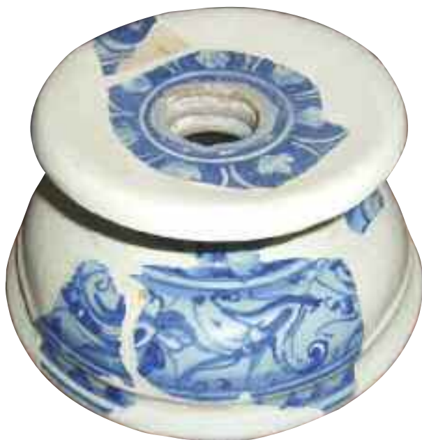
Tav. 13 - Urbino, bottega Patanazzi (?), seconda metà del XVI sec. Portacandela (da Santa Chiara); Galleria Nazionale delle Marche - Urbino.

cordano “un bacile bertino... piati de bertino da mezo grosso sedici ... e un bastardo e un da quattro carlini bertino” 40 . Il documento attesta una cospicua produzione di oggetti in berettino nella bottega di Antonio Patanazzi ed è il segno inconfutabile di una tradizione urbinata consolidata nell’uso dei fondali azzurrati che sfocerà poi nella produzione dell’ultimo esponente della bottega, Alfonso Patanazzi 41 . A questo ultimo grande ceramista urbinata e alla sua bottega, che reggerà dal 1616 al 1627, anno della sua