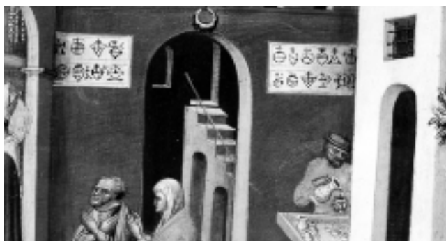
Tav. 11 - Bicci di Lorenzo (Firenze 1373-1452), San Nicola che risuscita tre fanciulli , 1433-1435; Metropolitan Museum New York.

coro a trofei , “in largo uso in tutto il Ducato di Urbino e nei centri limitrofi 31 , trova particolare sviluppo a Castel Durante come a Pesaro 32 , città alla quale, sia per tradizione che in base alle recenti