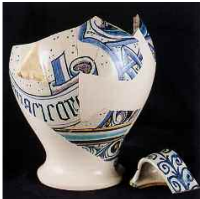
Tav. 7 a, b - Urbino fine sec. XV. Vasi da farmacia; Galleria Nazionale delle Marche, Urbino.

secoli XV e XVI 17 , le testimonianze ceramiche superstiti aiutano a conoscere e ad attestare la presenza di speziali e spezierie ad Urbino sul finire del Quattrocento. Tra le splendide maioliche rintracciate durante il lavoro di consolidamento e ristrutturazione di alcuni locali in Palazzo Ducale nel corso degli anni Novanta del secolo scorso, si possono individuare alcuni contenitori farmaceutici, seppur frammentari, di notevole importanza per un confronto stilistico con il boccale inedito che si presenta in questa occasione. In particolare, tralasciando alcuni frammenti di albarelli, l'attenzione in questo caso si volge verso due orcioli o versatoi 18 , simili per forma e cromia (tavv. 7a-b). I due vasi presentano una decora-