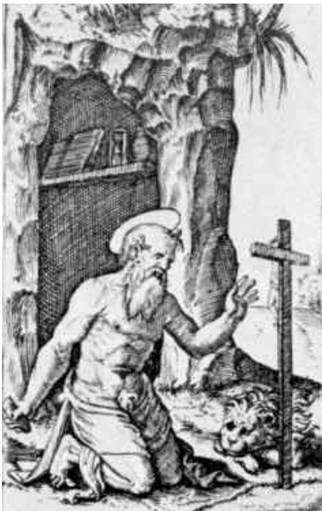
Tav. 12 - Marcantonio Raimondi (Molinella 1480 ? - Bologna 1534) San Girolamo , (Bartsch, 26-14, 152, vol. 1).

monia la volontà di recuperare il piatto già rotto ancora quando era in uso, considerandolo di pregio e di utilità. Ma la fragilità del materiale ed il tentativo di ancorare tra loro più pezzi hanno portato ad ulteriori rotture, destinando definitivamente l'oggetto alla sua definitiva dismissione.