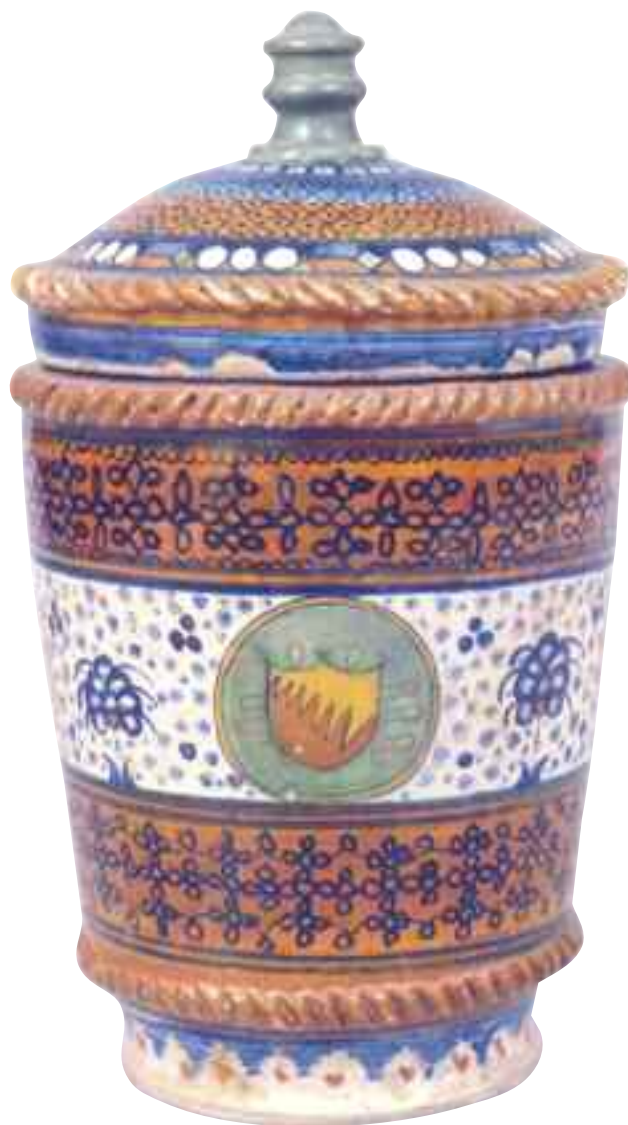
Tav. 3 - Faenza, fine sec. XV. Albarello con stemma famiglia Bentivoglio; Collezione privata.

Di dimensioni e forma simile alla ciotola appena descritta, è un altro singolare manufatto ceramico che però si differenzia per l'articolato decoro sempre di carattere religioso e più intimamente conventuale (fig. 3). Il piccolo oggetto racchiude una raffinata decorazione centrale in cui ai piedi di una croce si affrontano le figure miniaturizzate di un frate e probabilmente di una monaca. Le figure sono ritratte genuflesse in atto di preghiera mentre stringono tra le mani la corona del rosario. Sulla parete della ciotola si alternano due ampie fasce decorative: l'una più interna di color ocra è suddivisa a quartieri centrati da fiori stilizzati, l'altra più esterna vede una teoria di rombi concatenati dai profili ripassati in blu. Sulla parete esterna corrono su di uno smalto bianco coprente quattro filettature concentriche di color blu scuro alterna-