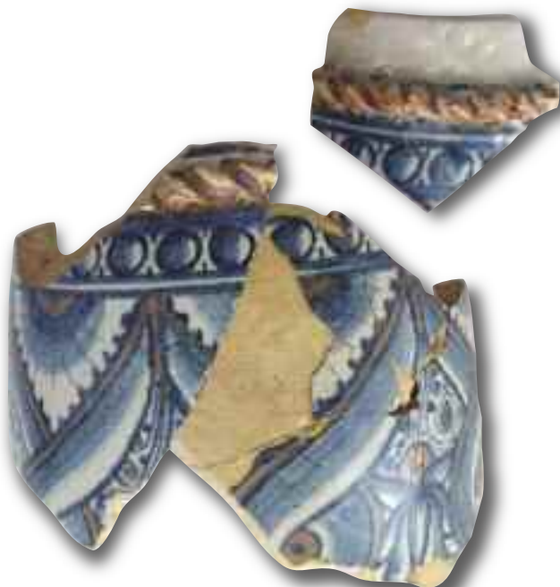
Tav. 1 - Faenza, fine sec. XV. Frammento di albarello; Istituto per le Industrie Artistiche, Urbino.

nosa ascrivibile alla produzione a lustro valenziana della fine del XV secolo con decoro fitomorfo stilizzato e trigramma bernardiniano al centro del cavetto (fig. 1). Prodotti di importazione spagnola di questa tipologia erano molto apprezzati dalle corti e dalle nobili famiglie del rinascimento e sporadici ritrovamenti ne attestano una certa diffusione sul territorio italiano, specie meridionale. Indicativo è l'esemplare di piattello lustrato prodotto a Manises nella seconda metà del sec. XV con stemma della famiglia Agostini di Fabriano 7 (tav. 4). Anche nel contesto urbinato si sono avuti riscontri simili sia tra i materiali di Palazzo Ducale che in quelli di Santa Chiara ma per