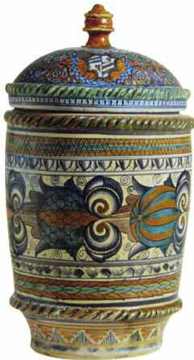
Tav. 2 - Faenza, fine sec. XV. Albarello con stemma famiglia Malatesti; Museo Internazionale delle Ceramiche, Faenza.

nosa ascrivibile alla produzione a lustro valenziana della fine del XV secolo con decoro fitomorfo stilizzato e trigramma bernardiniano al centro del cavetto (fig. 1). Prodotti di importazione spagnola di questa tipologia erano molto apprezzati dalle corti e dalle nobili famiglie del rinascimento e sporadici ritrovamenti ne attestano una certa diffusione sul territorio italiano, specie meridionale. Indicativo è l'esemplare di piattello lustrato prodotto a Manises nella seconda metà del sec. XV con stemma della famiglia Agostini di Fabriano 7 (tav. 4). Anche nel contesto urbinato si sono avuti riscontri simili sia tra i materiali di Palazzo Ducale che in quelli di Santa Chiara ma per