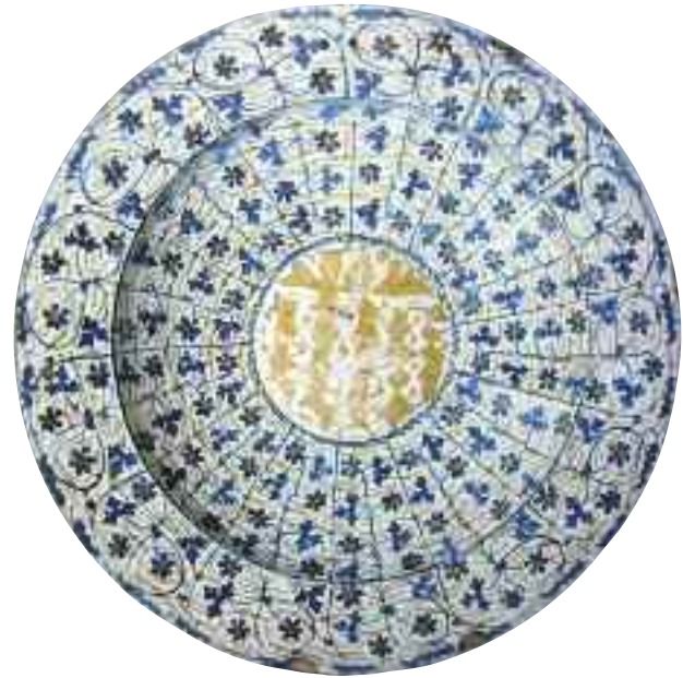
Tav. 5 - Manises, fine sec.XV. Piatto a lustro; Museo Nazionale di Capodimonte Napoli.

Se durante le prime indagini a prevalere tra i reperti ceramici furono le forme aperte quali, piatti ciotole e scodelle nel nucleo di maioliche interessate dalla seconda campagna di restauro si segnalano ben cinque boccali, tutti molto significativi