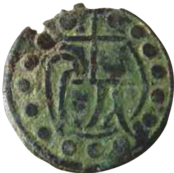
Tav. 10 - Ducato di Urbino (?), sec. XV-XVI. Tessera mercantile; ubicazione sconosciuta.

mobiliari, e fungeva in un certo senso da 'stemma' (come dire: laico?) tanto che spesso veniva inciso come segno di riconoscimento anche sulle pietre tombali, magari insieme a simboli dell'arte che il mercante o l'artigiano aveva professato. Questi segni che oggi ci appaiono spesso incomprensibili e misteriosi, erano in genere formati da una croce, o una stella ad asterisco, o un fiore, uniti quasi sempre ad un intreccio di lettere che formavano un monogramma 27 . Per una esemplificazione pittorica è utile far riferimento ad un particolare della tavola realizzata da Bicci di